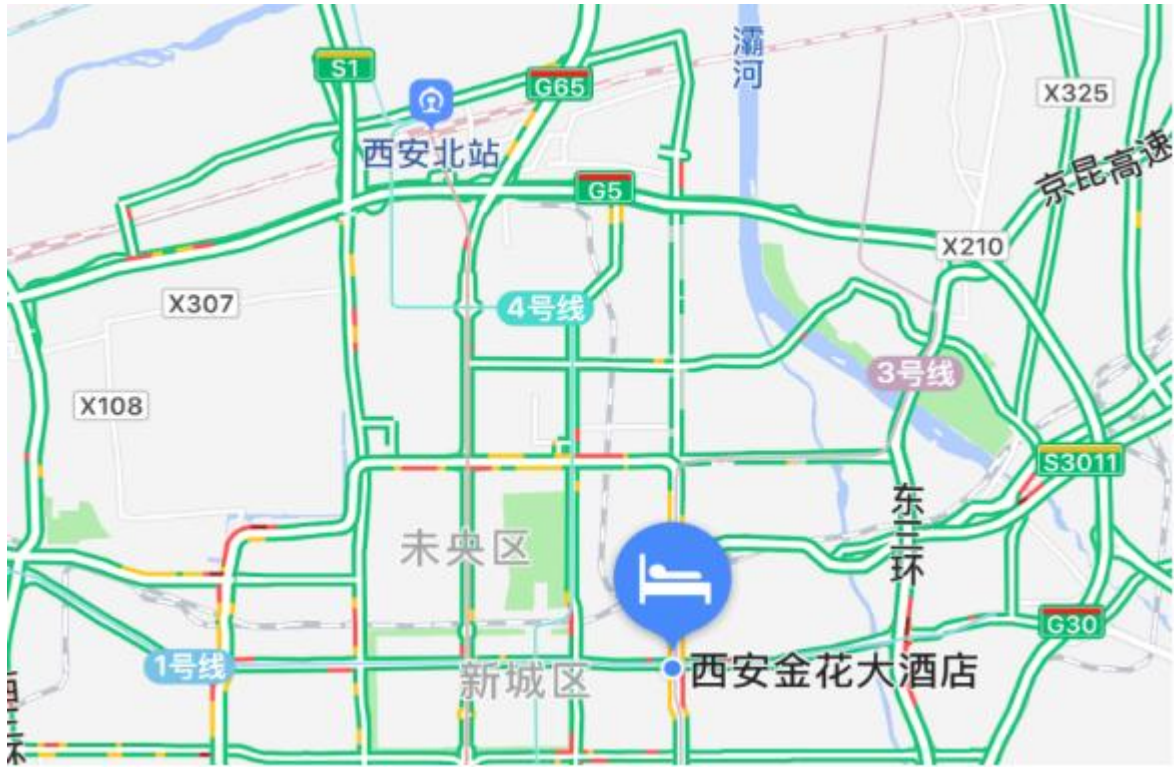
西安金花大酒店位置示意图